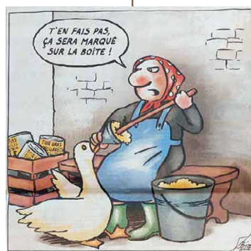
Caricature parue dans le quotidien romand 24 heures

https://stopfleber-initiative.ch/wp-content/uploads/2025/01/2019-03-21-TA-Schweizer-sollen-keine-Stopfleber-und-Froschschenkel-mehr-essen.pdf